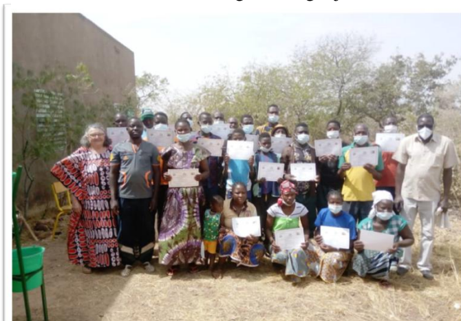
Centre de formation de DABOURA, tenue d'une session de formation en Agroécologie janvier 2021

également donner un plus par la transformation des produits locaux. Un atelier de transformation est disponible et un groupe de femmes organisées en coopérative existe. Il s'agira de les aider à mieux se structurer pour mettre en place une vraie unité de transformation avec recherche de marché local et extérieur permanent et sûr. Des tentatives sont en cours et nous avons mis en place l'accompagnement de 5 groupes de femmes : Stage de formation de 5 femmes chez les sœurs de Bobo ; rencontre des 5 groupes de femmes pour partager leurs expériences de transformation ; réunion des responsables des 5 groupes pour s'organiser et travailler en synergie ; voyage d'étude à Nouna pour voir l'expérience de Madame Nyamba. Les trois premières activités ont bien pu se tenir. Seule la dernière a été reportée compte tenu de la situation de sécurité et du couvre-feu qui prévaut à Nouna