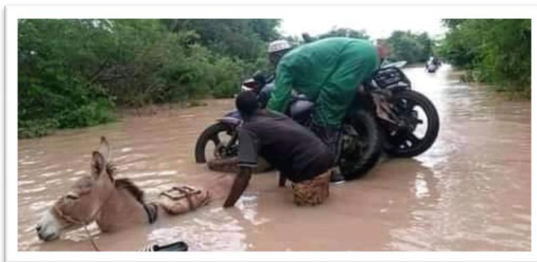
Daboura le 11 août 2021